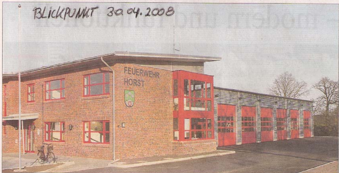
Das moderne Gerätehaus am Langenkamp hat fünf Stellplätze für die Einsatzfahrzeuge der Freiwilligen Feuerwehr Horst.