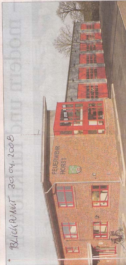
moderne Gerätehaus am Langenkamp hat fünf Stellplätze für die Einsatzfahrzeuge der Freiwilligen Feuerwehr Horst.