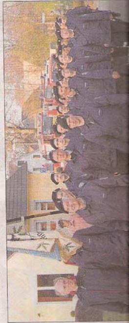
Geschlossen, die Fahrzeuge marschieren hinteran, die Horster Feuerwehrleute vom alten Gerätehaus durch die Gemeinde zur neuen Wache.

erst (mo). Nach nur 17 Monaten Planungs- und Bauphase ist am Sonntagabend, 3. Mai, das neue Gebäude der Freiwilligen Feuerwehr Horst offiziell eingeweiht. Voll einsatzfähig und "Dienst" sind Haus und Gerätehaus.