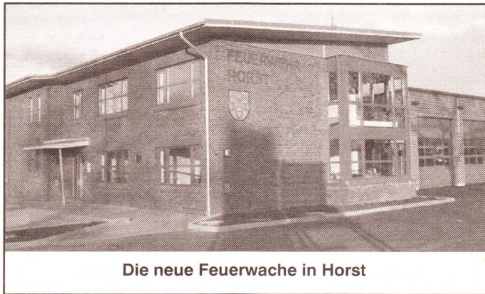
Die neue Feuerwache in Horst

HORST. Das Architekturbüro Butzlaff und Tewes aus Brande – Hörnerkirchen wurde im Oktober 2006 mit der Generalplanung für den Neubau der Feuerwache von der Gemeinde Horst beauftragt. Gemeinsam mit dem Bauausschuß der Gemeinde und der Feuerwehr wurden hinsichtlich der besonderen Anforderungen der Feuerwehr Horst in der Entwurfsphase Pläne entwickelt. Dabei war es wichtig, neben der Funktionalität, vor allem die Wirtschaftlichkeit des Neubaus sicherzustellen, wie zum Beispiel eine Reduktion des Energiebedarfs und eine zukunftssichere technische Gebäudeausrüstung. Besondere Aufmerksamkeit bei der Planung erfuhr die erfreulich starke Gruppe der Jugendfeuerwehr, der zukünftig ein eigener Schulungsraum zur Verfügung